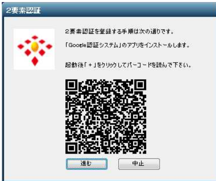
登録に必要なバーコード(QRコード)の画面